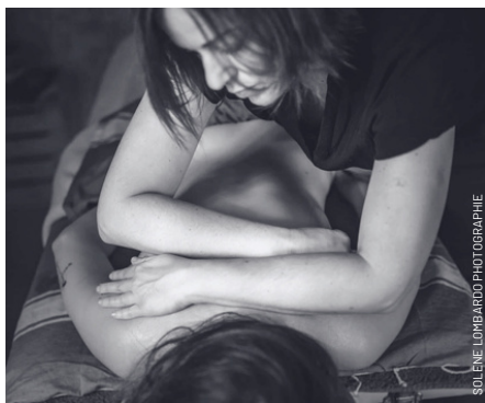
SOLÈNE LOMBARDO PHOTOGRAPHIE